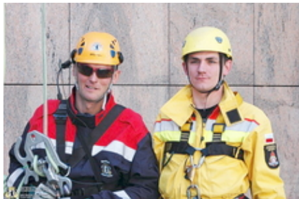
Berliner und Stettiner Höhenretter