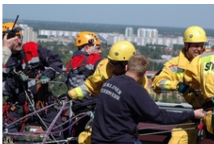
Alle ziehen an einem Strang