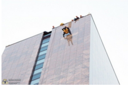
Berliner und Stettiner Retter seilen sich gemeinsam ab