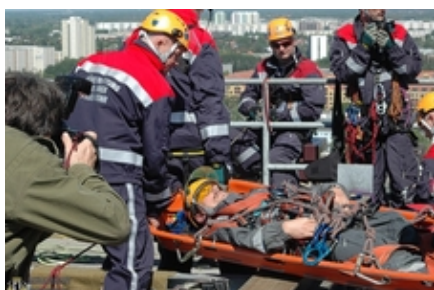
Rettung mit der Korbtrage