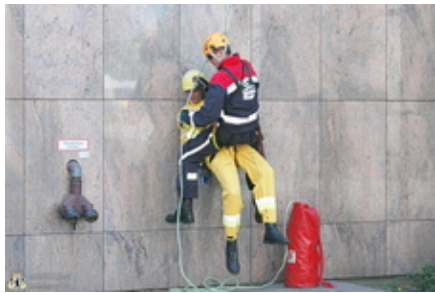
Am Boden angekommen